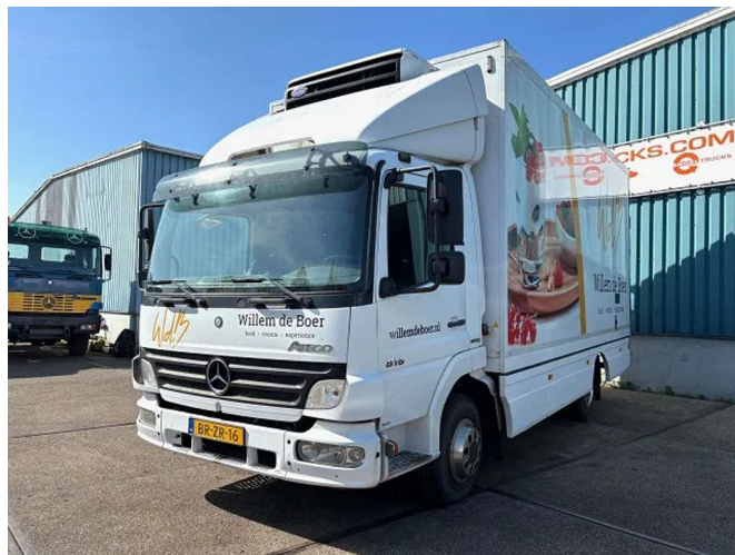
Mercedes-Benz Atego 816 L 4x2 ORIGINAL DUTCH COOLE...