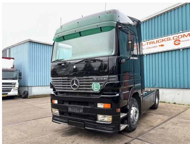
Mercedes-Benz Actros 1840 LS (MP1) 4x2 MEGASPACE (E...