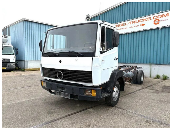
Mercedes-Benz LK 914 4x2 FULL STEEL CHASSIS (6-CILIN...