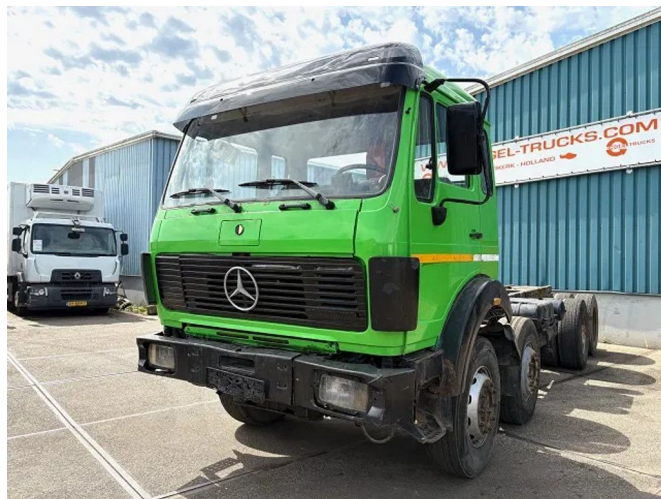
Mercedes-Benz SK 3335K 8x4 FULL STEEL CHASSIS (ZF16... Referentienummer: SN 58605144 Z